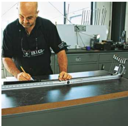
Zeit der Schlägeranalyse

sondern daneben auch noch den Ball in etwa im Wunschwinkel fliegen lässt, erfordert ein sehr spezielles Know-how. Die Dynamik des Abschlags versteht man nicht, bloß weil man den Impulserhaltungssatz aufsagen kann. Auch für die Wissenschaft ist der Club, wie der Schlagstock in der Golfersprache Englisch heißt, ein äußerst unangenehmes Untersuchungsobjekt. Er biegt sich (»Flex«), verwindet sich in der Längsachse (»Torsion«), verschieden frequente Schwingungen überlagern sich in drei Dimensionen.