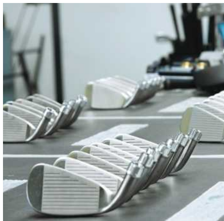
Der Stahl stammt aus Fernost

schwer zu spielen. Wer Blades im Bag hat, zeigt, dass er ein toller Hecht ist. Eine wichtige, wenn nicht entscheidende Qualität des Schlägers ist nämlich seine forgiveness . Der Blade aber sieht zwar elegant aus, ist jedoch gnadenlos, was einen schlechten Abschlag angeht. Das verbreitete Unvermögen, den Schlägerkopf im geheimnisumwitterten »Sweet Spot« zu treffen, also im Bereich des besten Effekts, bestraft der Blade sofort.